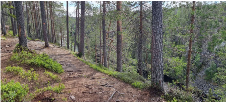
Julma-Ölkky, Hossan kansallispuistossa