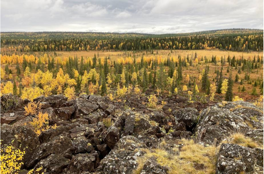
Pirunirkon laen näkymiä

Kun palasimme takaisin, otimme rinkat ja hipsimme Kuskoivan rinteitä pitkin Nuoluskurun kodalle. Ruska oli nätti! Kodalla olivat suunnilleen kaikki ja se päivällä nähty nainenkin. Telttapaikkoja oli onneksi hyvin. Iltasella alkoi sade, jota kestitkin sitten suunnilleen loppureissun ajan, tosin välissä oli puolenkin päivän mittaisia taukoja. Jotkut kävivät illalla ”lehtikylvyssä” Nuoluskurun pohjalla.