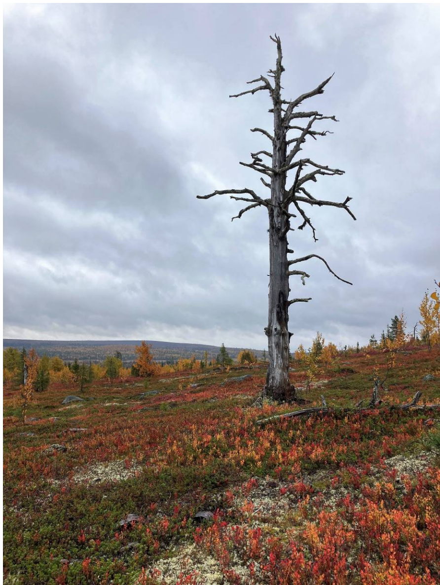
Purnuvaaralla Kuva: Veera Yli-Jama