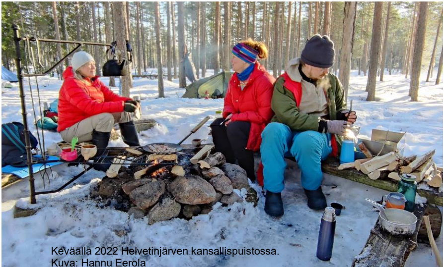
Keväällä 2022 Helvetinjärven kansallispuistossa.